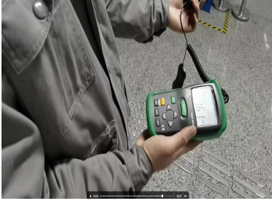
1A 出入口负二楼通道电梯前端