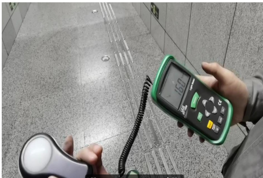
1A 出入口负二楼通道前端